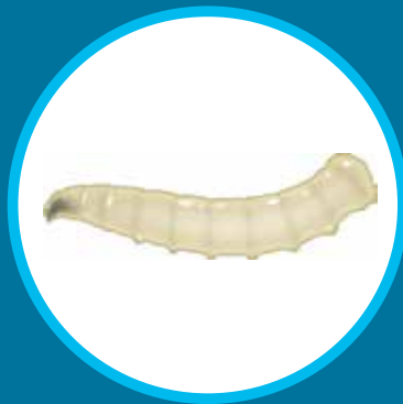
Larve de mouche