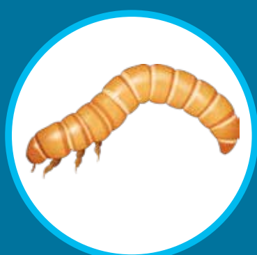
Larve de ténébrion