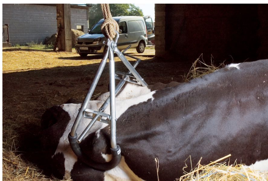
Visuel B: En utilisation sur une vache